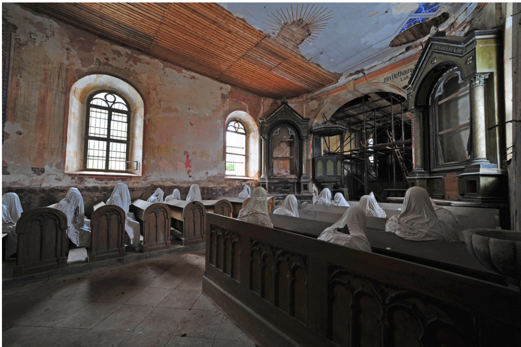
„Věřící“. Kostel sv. Jiří, Luková. Foto Jakub Hadrava.

Vydání Kratochvilovy monografie lze přivítat zejména proto, že propojuje traumatologické zkoumání v literatuře, které bylo dosud pěstováno především v anglosaském světě, se středo- a východoevropskou perspektivou. Rozšiřuje také pole zkoumání o další, tradičně upozadované žánry a média. Jako metodologický impuls může přispět nejen k uplatnění tohoto interdisciplinárního přístupu na literární texty, které o dějinných traumatech tak či onak pojednávají, ale i na vztah mezi psaným textem a mimoliterární skutečností vůbec.