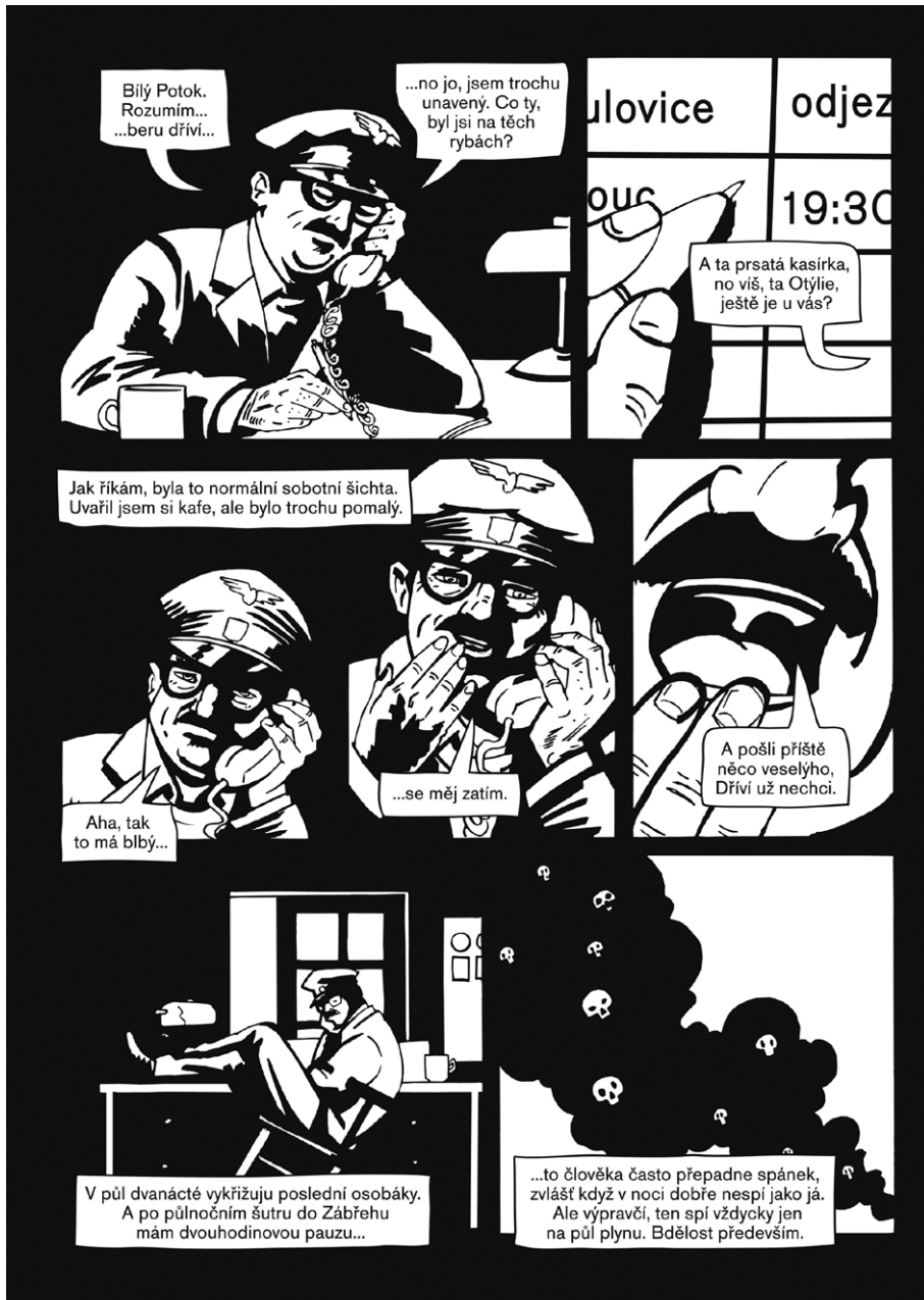
Lebky v dýmu. Alois Nebel.

místo“ a participujících na vztahových a agenčních vzorcích subjektů v textu tím, že na sebe „duch vzpomínek“ bere podobu výtvarně realizované „bytosti“ a může vstupovat do dialogu s postavami reprezentujícími lidské aktéry. Komiks nebo graphic novel jakožto vizuální médium pak poskytuje pro ztvárnění těchto mimolidských subjektů specifické možnosti, a to právě v tom, že není omezen na čistě verbální vyjádření, které, jak